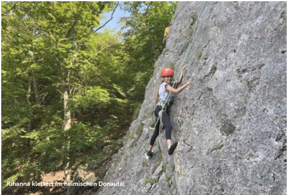
Rihanna klettert im heimischen Donautal