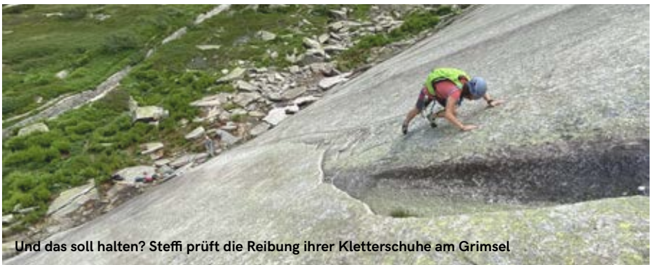
Und das soll halten? Steffi prüft die Reibung ihrer Kletterschuhe am Grimsel

Dienstag, 1. Juli 2025 - Siehe auch Beschreibung S. 9