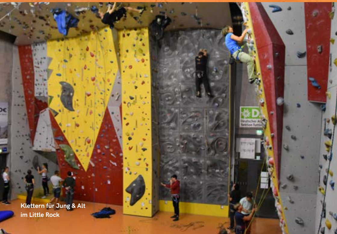
Klettern für Jung & Alt im Little Rock