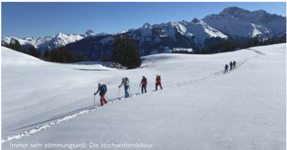
Immer sehr stimmungsvoll: Die Hochwinterskitour