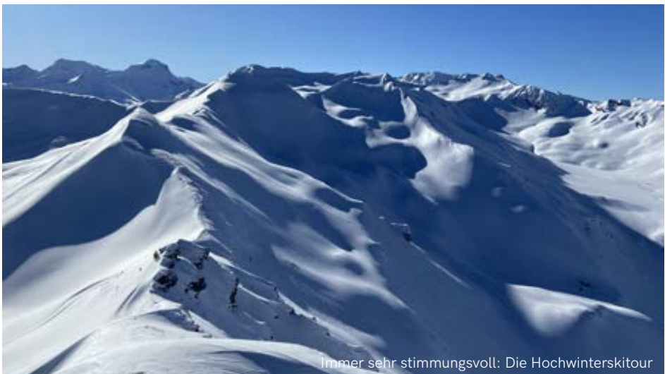
Immer sehr stimmungsvoll: Die Hochwinterskitour