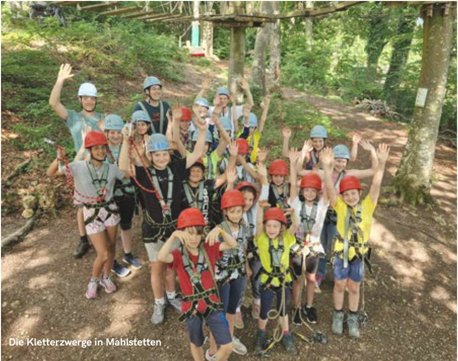
Die Kletterzwerge in Mahlstetten