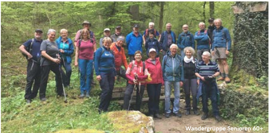
Wandergruppe Senioren 60+