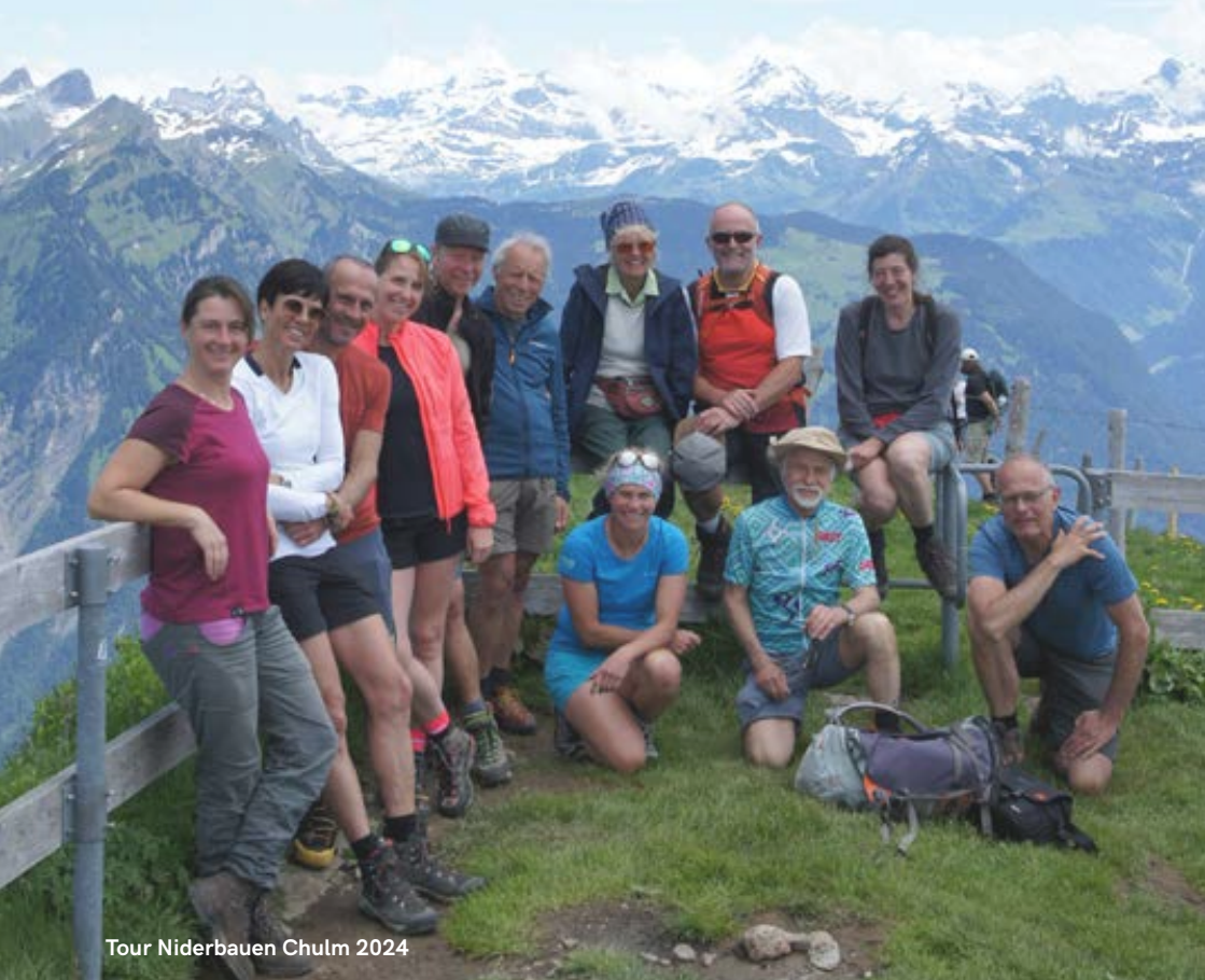
Tour Niderbauen Chulm 2024