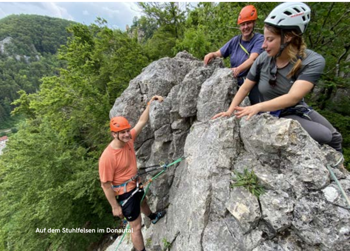
Auf dem Stuhlfelsen im Donautal