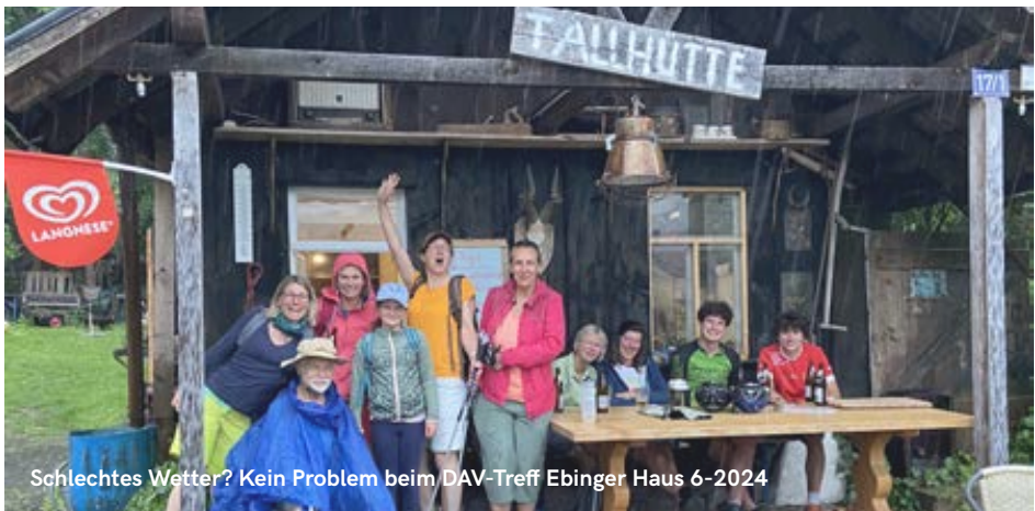
Schlechtes Wetter? Kein Problem beim DAV-Treff Ebinger Haus 6-2024

Dienstag, 24. Juni 2025 - Siehe auch Beschreibung S. 9