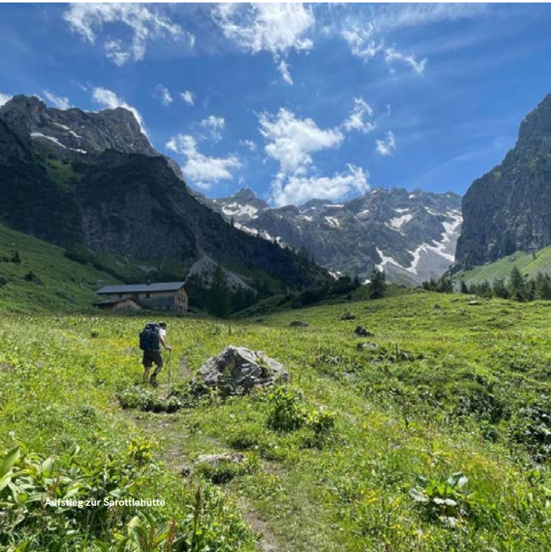
Aufstieg zur Sarottflahütte

Bei Seniorentouren und Touren der Familiengruppe die Hälfte der genannten Angaben.